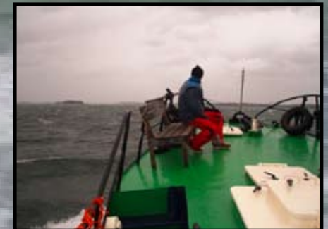
Marko ja myrsky.

Reissu oli antoisa ja olemme taas yhtä kokemusta rikkaampia. Matkan hinta oli 65€/hlö, jonka lisäksi Navigaatioseura kustansi toisen puolen. Alustavasti oli myös