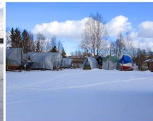
Kevättä satamassa 22.3. Veneet vielä talvihorrossessa.