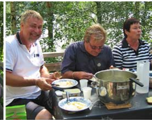
Kuhakeitto maistui Salonsaassa 12.7.