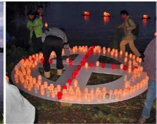
Birgitan tulet Myllyrannassa 30.8.