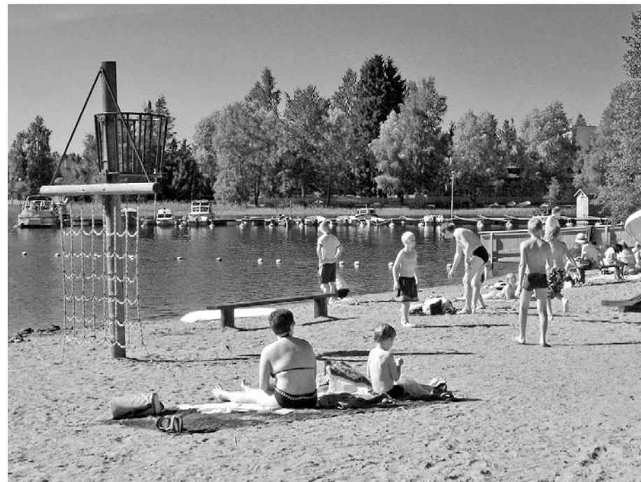
Sinilippu-uimaranta mallia Heinola. Uimaranta ja Venesatama mahtuvat vierekkäin.