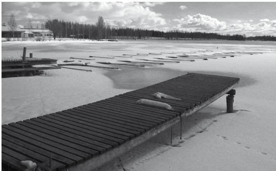
Uittorannan satamaa maaliskuussa. Paikat vielä hetken tyhjinä.