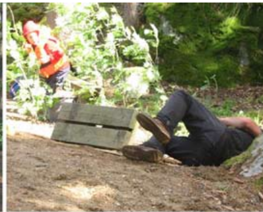
Lentopalloa Nokian Veneilijöitä vastaan juhannuksena Salonsaarella nokialaisten kentällä. Kaikkemme yritettiin.