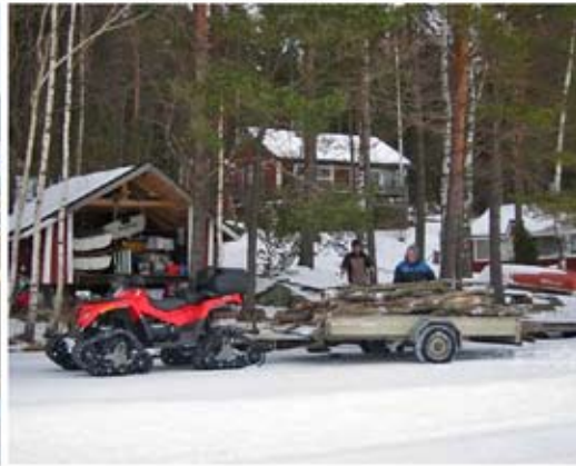
Tästä se talven odottelu alkaa. (Oik.) Puutalkoissa Pursipirtillä. Kyllä sitä huononakin talvena aina jollakin.