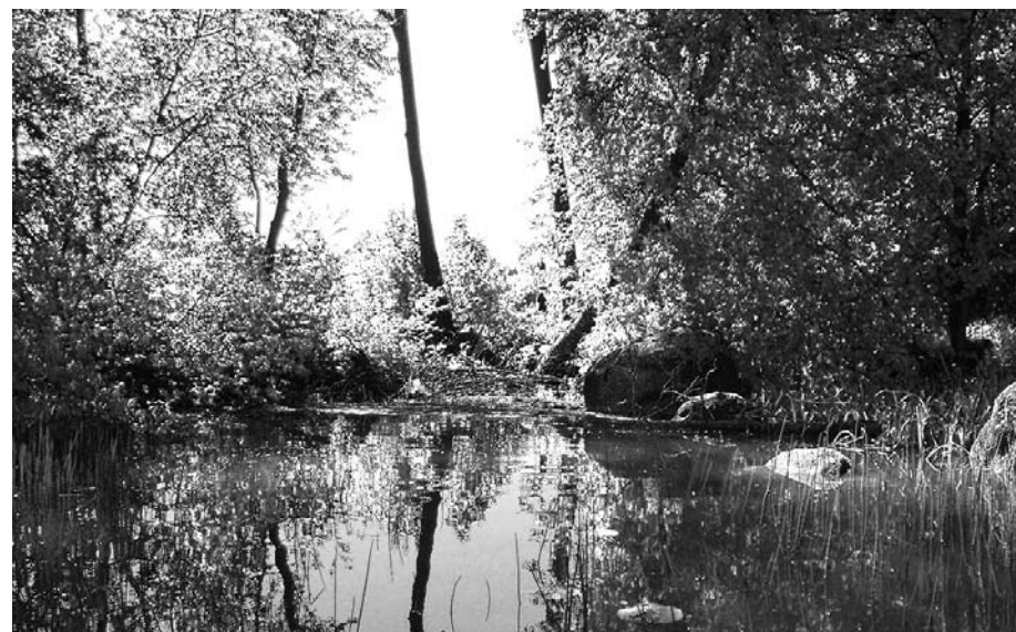
Kuva-arvoitus: Minkä Lempäälässä sijaitsevan kanavan yläjuoksun puoleinen suu on oheisessa kuvassa? Vastaus sivulla 16.