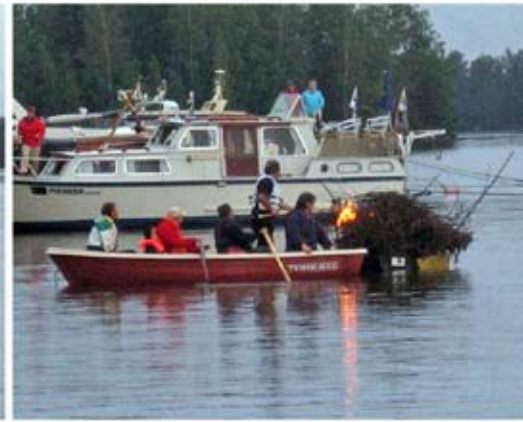
Kyllä se siitä. Ja nokialaiset on ihmeissään, että bensalla.